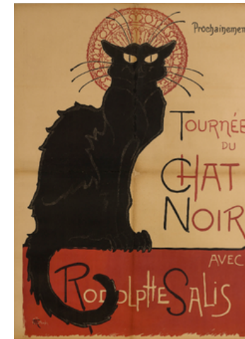
Théophile Alexandre Steinlen Prochainement Tournée Du Chat Noir Avec Rodolphe Salis, 1896

Samedi 30 mai : Matinée : Visite libre (une série d'œuvres sur les animaux fantastiques et réels) et Réalité Virtuelle - Visites guidées et ateliers (15h et 16h30) : Les animaux à l'affiche ! À partir des œuvres du Musée numérique et des créatures légendaires du Pays Basque, créez une affiche collective et votre propre affiche. Capacité d'accueil : 15 personnes. Réservations au 06.72.25.81.59 🎨