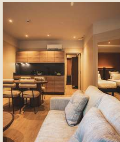
5 appartements 4 personnes 45m 2 à 76m 2