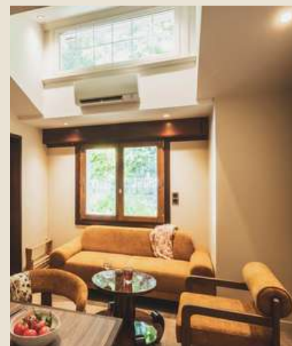
1 appartement 5 personnes 55m 2