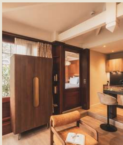
1 appartement 2-3 personnes 40m 2