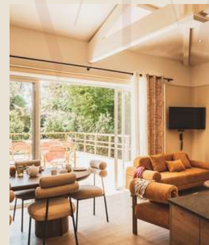
3 appartements 6 personnes 65m 2 et 110m 2

Spacieux, lumineux et chaleureux, nos appartements sont de véritables espaces de vie. Avec leur cuisine équipée et leurs grandes ouvertures sur l'extérieur, chacun possède son propre caractère pour un séjour qui vous ressemble.