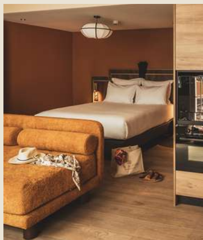
2 studios 2 à 3 personnes 40m 2